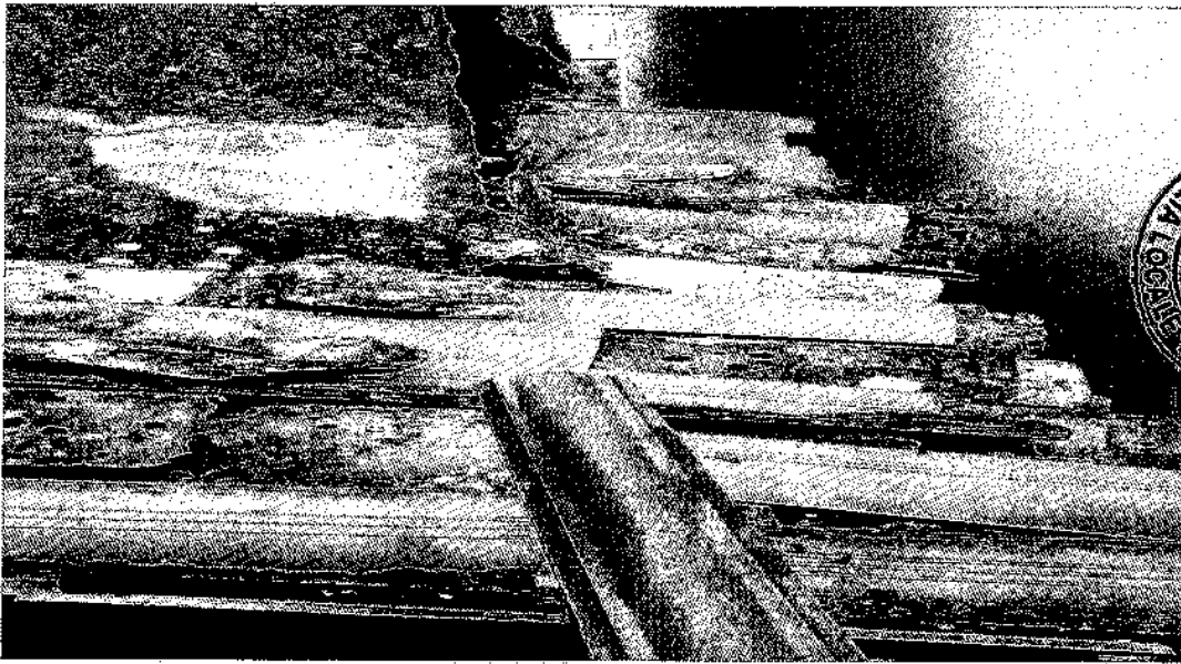
Rilievo fotografico del 03.02.2018 Foto n° 01 particolari del tetto con tegole smosse